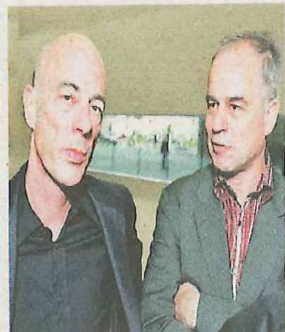
Die Architekten Jacques Herzog (l.) und Pierre de Meuron haben das 400 bis 500 Millionen Franken teure Projekt entworfen.